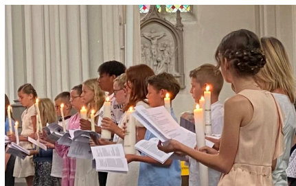
Eerste communie en vormsel