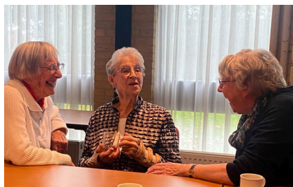
Omzien naar elkaar